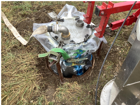
BILD NACH INSTALLATION